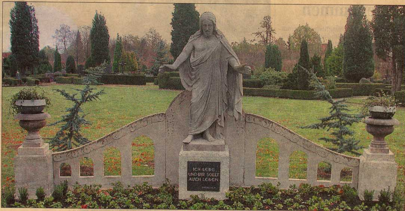
Heißt die Besucher auf dem Wennigser Friedhof willkommen: die rund 100 Jahre alte Jesus-Statue nahe der Kapelle.